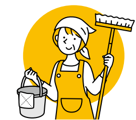
屋内 (外) の清掃