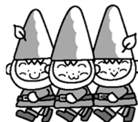
ぬつくん・まつくん・たつくん